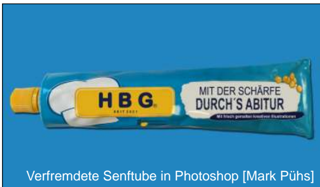
Verfremdete Senftube in Photoshop [Mark Pühs]

ERWEITERTE BERUFLICHE KENNNTNISSE IM BERUFSFELD GESTALTUNG